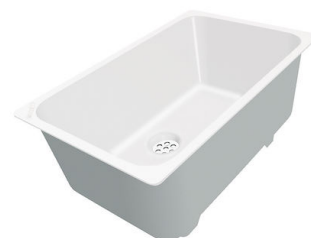
Vaschetta bianca 8153 100