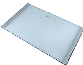
Tagliere in cristallo 8633 300